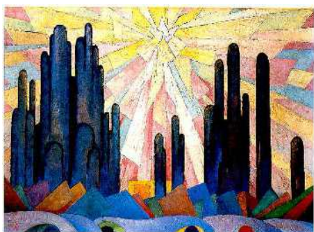
Lux in tenebris