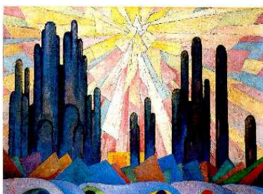
Lux in tenebris