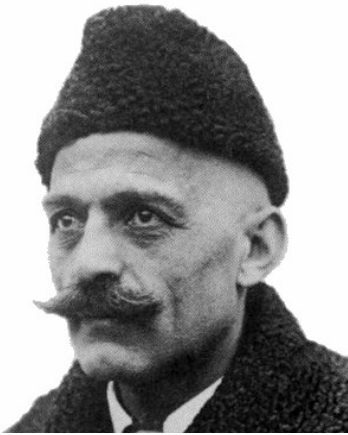
Георгий Гурджиев (1872(?)-1949)