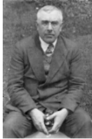
Петр Успенский (1878-1947)

Запомните и регулярно практикуйте следующее: